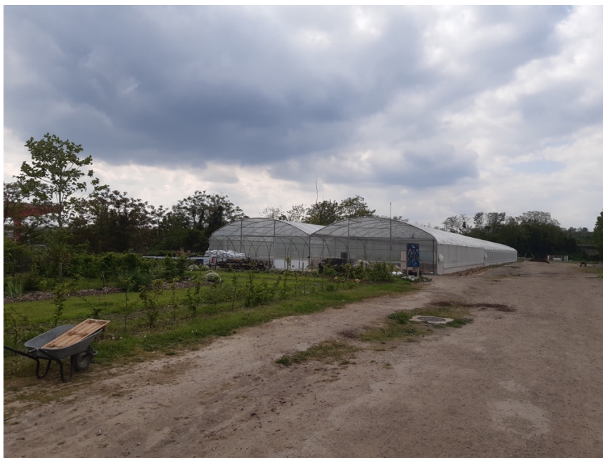
Horticulture (production de fleurs bio, locales, en circuit court)