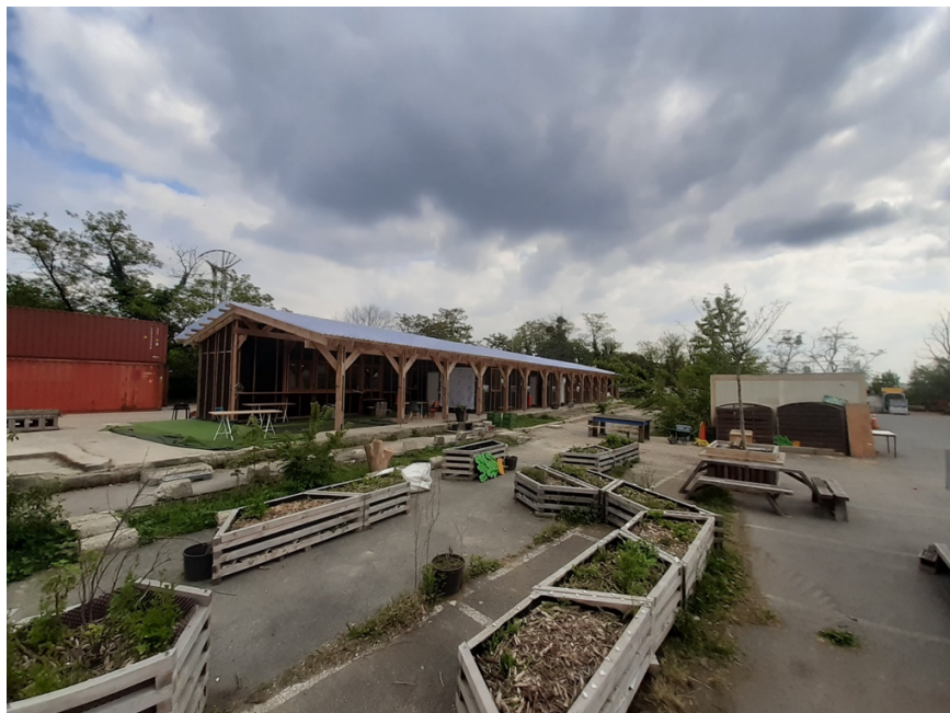
La guigette de Lil'ô (espace de convivialité et restauration)