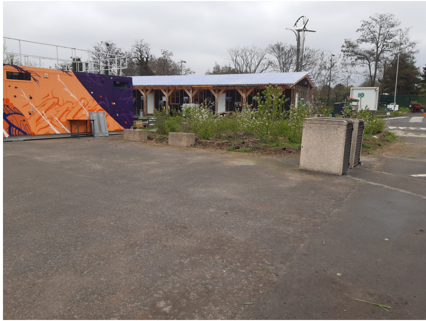
Emplacement de la sculpture de Lil'ôsculptures 2023