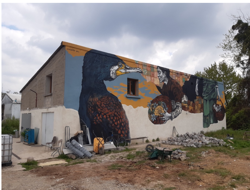
Base de vie (atelier des équipes de jardiniers)