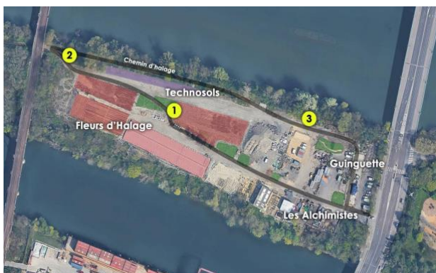
Le plan du parcours LIL'ÔSCULPTURES